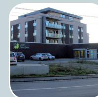
Centre Médical des Ascenseurs