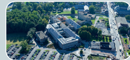
Site Le Tilleriau

Découvrez toutes les informations relatives à notre équipe et nos équipements présents sur nos différents sites et centres médicaux.