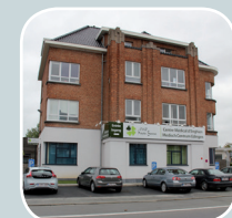
Centre Médical d'Enghien