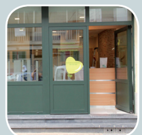
Centre Médical Brainois