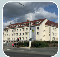
Site Saint Vincent